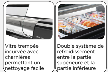
Vitre trempée incurvée avec charnières permettant un nettoyage facile